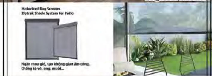
Motorized Bug Screens Ziptrak Shade System for Patio