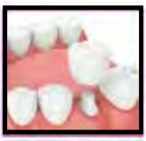
Single Tooth Dental Implant

Có trên 15 năm kinh nghiệm Fellow International Congress Oral Implantologists